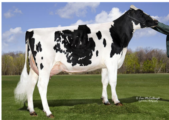
STRAUSSDALE ESCALADE 1584