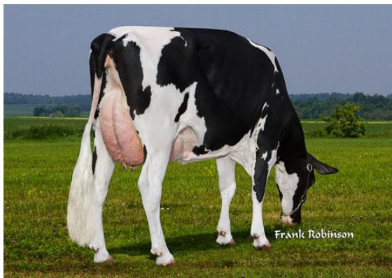
LORINDA ESCALADE 3198